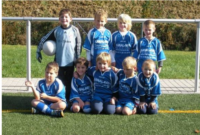
Die Bambinis des SC Kaltbrunn in der Saison 2008/2009

Neue Gesichter sind hier, wie in anderen Jugenden, natürlich jederzeit herzlich willkommen.