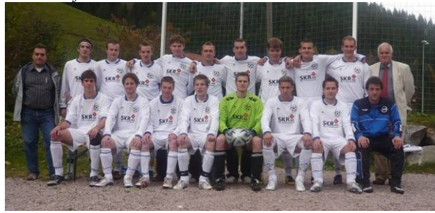
Erste Mannschaft des SC Kaltbrunn in der Saison 2008/2009