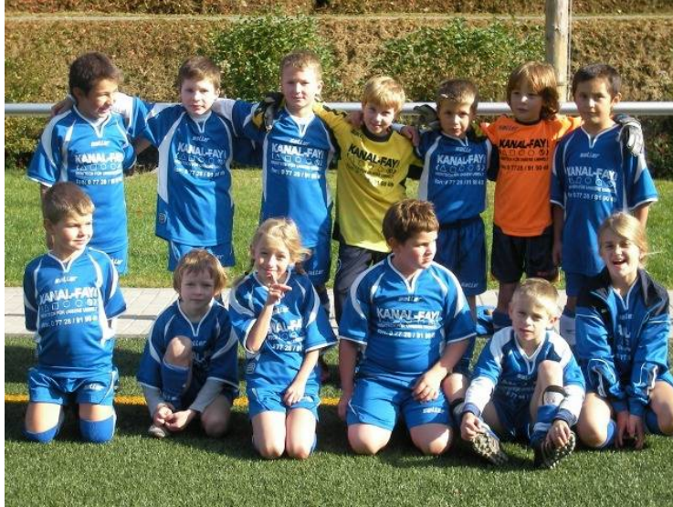
Die F-Junioren des SC Kaltbrunn in der Saison 2008/2009