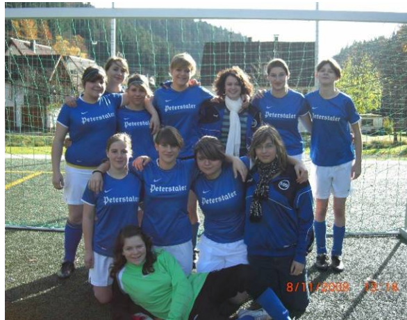
Die B-Juniorinnen des SC Kaltbrunn in der Saison 2008/2009