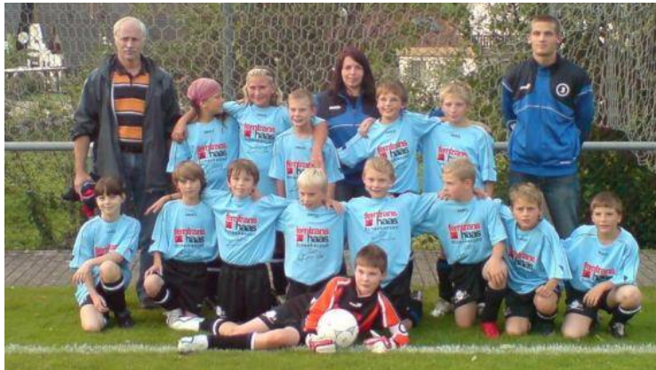
Die E-Junioren des SC Kaltbrunn in der Saison 2008/2009