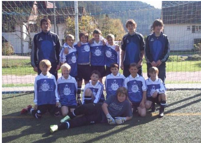
Die D-Junioren des SC Kaltbrunn in der Saison 2008/2009