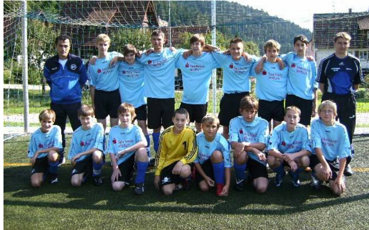
Die C-Junioren des SC Kaltbrunn in der Saison 2008/2009