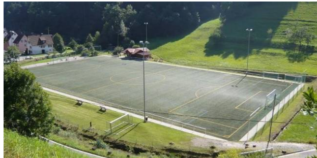
Sportanlage des SC Kaltbrunn 1967 e. V.

Seither spielen die Aktiven Mannschaften im Bezirk Nördlicher Schwarzwald. Aufgrund der erfolgreichen Jugendarbeit und des aktiven Spielbetriebs, konnte man 2006 auch mit dem langersehnten Kunstrasenbau beginnen. Somit wurden noch bessere Möglichkeiten geschaffen, um den Verein weiter auf Kurs zu halten. 2008 gelang dem SC Kaltbrunn ein Meisterschafts – Doppelpack. Der A-Jugend wie auch der 1. Mannschaft gelang der Aufstieg.