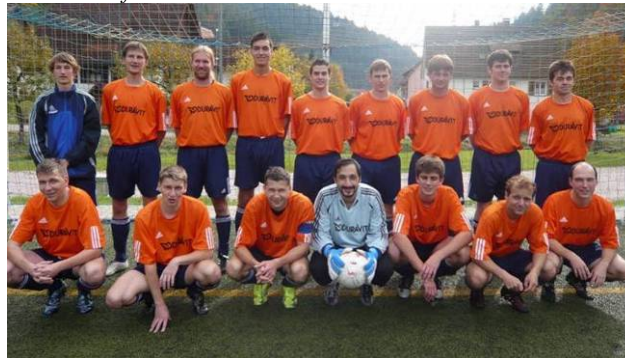
Reservemannschaft des SC Kaltbrunn in der Saison 2008/2009