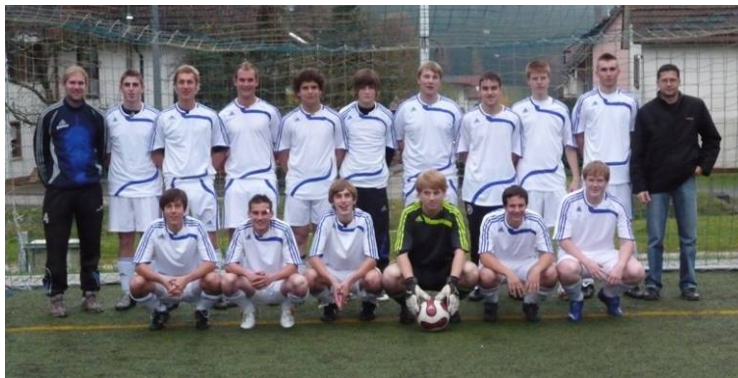
Die A-Junioren des SC Kaltbrunn in der Saison 2008/2009